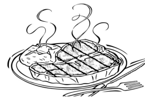
Plate lunch with meat dish, salad and bread or rice お肉料理とサラダ&パンorライス付きのプレートランチ